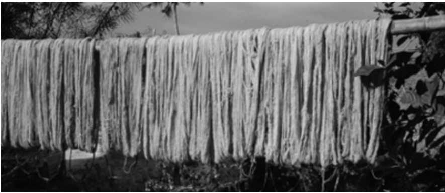
3rd bath, drying yarns, Savu

In 2017 heb ik met dank aan jullie bijdrage een onderzoeksreis door Indonesië kunnen maken. Met focus op modder als centraal materiaal. Mijn reis voerde me langs diverse eilanden zoals Timor, Sumba, Sulawesi en Savu. Mijn doel was om een diepgaand inzicht te krijgen in het traditionele gebruik van modder en de technieken achter aarde-doordrenkte textielen. Verschillende regio's boden diverse inzichten. Terwijl Timor en Sumba met hun tropische klimaat een specifieke moddersamenstelling en -toepassing lieten zien, boden de droge kustgebieden van Savu en de berggebieden van Java weer een heel ander perspectief. Wat opviel, was de variëteit aan tinten die voortkwamen uit verschillende mineralen samenstellingen in de modder. Daarnaast het gebruik van modder in rituelen, om te communiceren met de voorouders, in maskers om kwaad af te weren, en als eerbetoon aan mythische wezens die in modderpoelen of moddervulkanen leven.