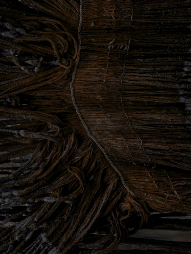
first mudd bath, Sumba

Mijn huidige project, de 'Mudd suit', is direct geïnspireerd door deze bevindingen. Daarnaast ben ik bezig met het samenstellen van een sample boek vol moddermonsters, wat een visueel verslag zal vormen van de diverse moddersoorten die ik ben tegengekomen. Verder ben ik van plan de 6 uur aan geluidsopnamen, die zowel omgevingsgeluiden als interviews bevatten, te analyseren en te gebruiken om mijn onderzoek te verdiepen.