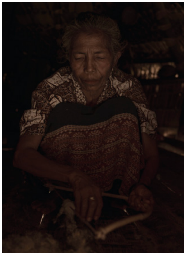
Making Clouds, Savu

Het onderzoek bracht ook andere patronen aan het licht. Deze patronen, zichtbaar in zowel textiel als in de bredere cultuur en architectuur, gaven inzicht in de invloed van de omgeving op het dagelijks leven en handwerk.