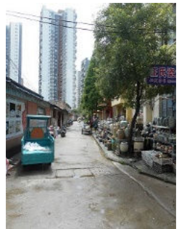
Mijn werkplek in The Pottery Workshop

Het gebied waar de Pottery Workshop zich bevindt is een oase in de stad Jingdezhen met 1,2 miljoen inwoners, voor Chinese begrippen een provinciestad. Aan één straat met een "front gate" en een "back gate" bevinden zich kleine zijstraten waar allemaal bedrijven huizen met hun eigen specialisme: de mallenmaker, de glazuurman, de man die porselein giet, de vrouw die alleen maar op-glazuur schildert enz. Veel van deze mensen werkten tot eind van de negentiger jaren in de fabrieken die allerhande porselein fabriceerden en daar hadden ze hun eigen taak maar toen deze fabrieken failliet gingen zijn vele van hen hun eigen bedrijfje begonnen in het specialisme wat ze toen in de fabrieken al hadden. Bijna alle bedrijven die in Jingdezhen gevestigd zijn en dat zijn er veel - de hele stad is porselein - zijn nu privé bezit.