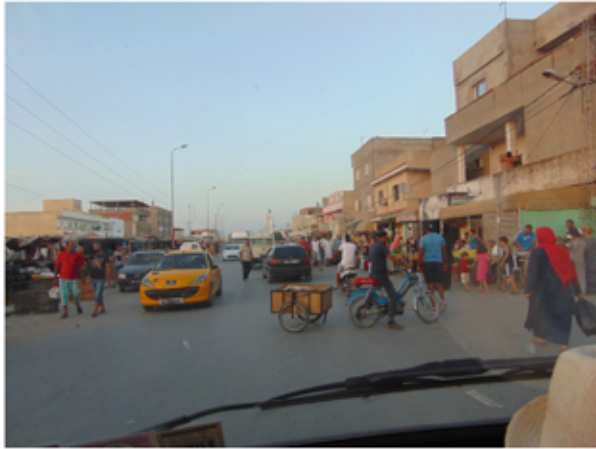
stadsbeeld in Ben Arous

Er heerst al weken een hittegolf rondom de Middellandse zee. Temperaturen van 40 graden zijn gewoon, op sommige plaatsen wordt zelfs 50 graden gemeten. Na mijn eerdere ervaring met dergelijke temperaturen ga ik met een beetje vrees maar met goede moed op reis met de auto. Bestemming Tunesië.